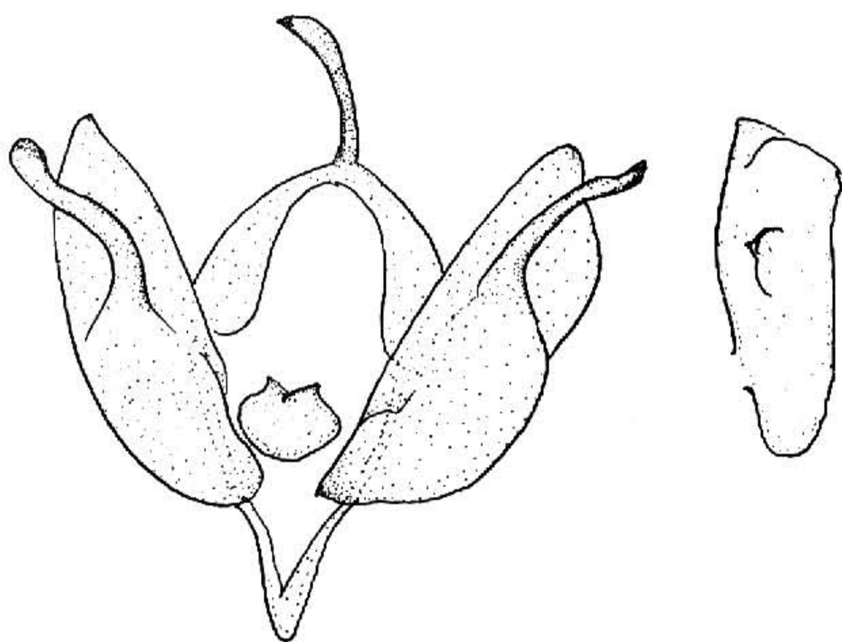
图166 星狭翅夜蛾 Hermonassa planeta Chen ♂ 外生殖器

Hermonassa planeta Chen, 1993, Sinozool. 10: 364, fig. 2. (云南维西)