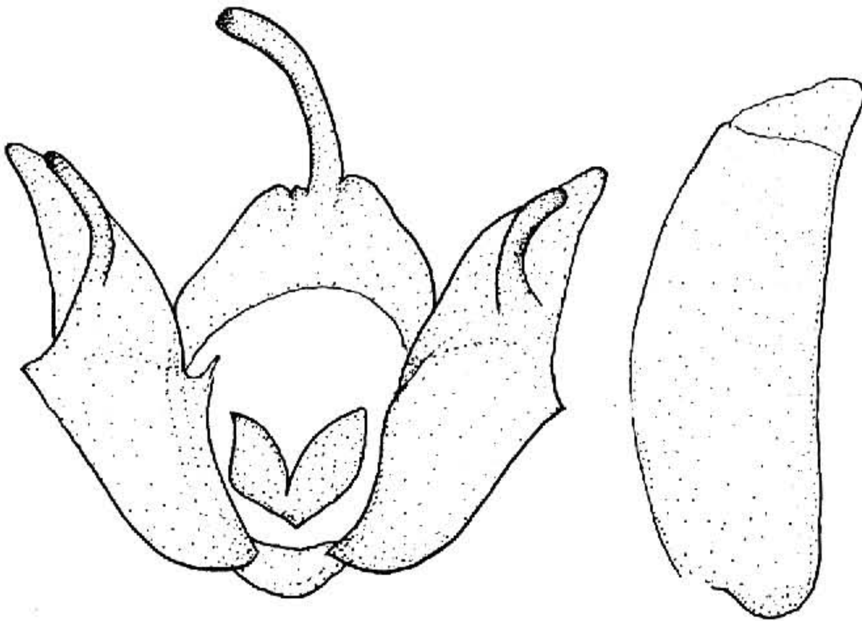
图 170 坦狭翅夜蛾 Hermonassa connudata Chen ♂ 外生殖器

Hermonassa connudata Chen, 1991, Acta ent. Sin. 34 (3) L353, fig. 4. (西藏亚东)