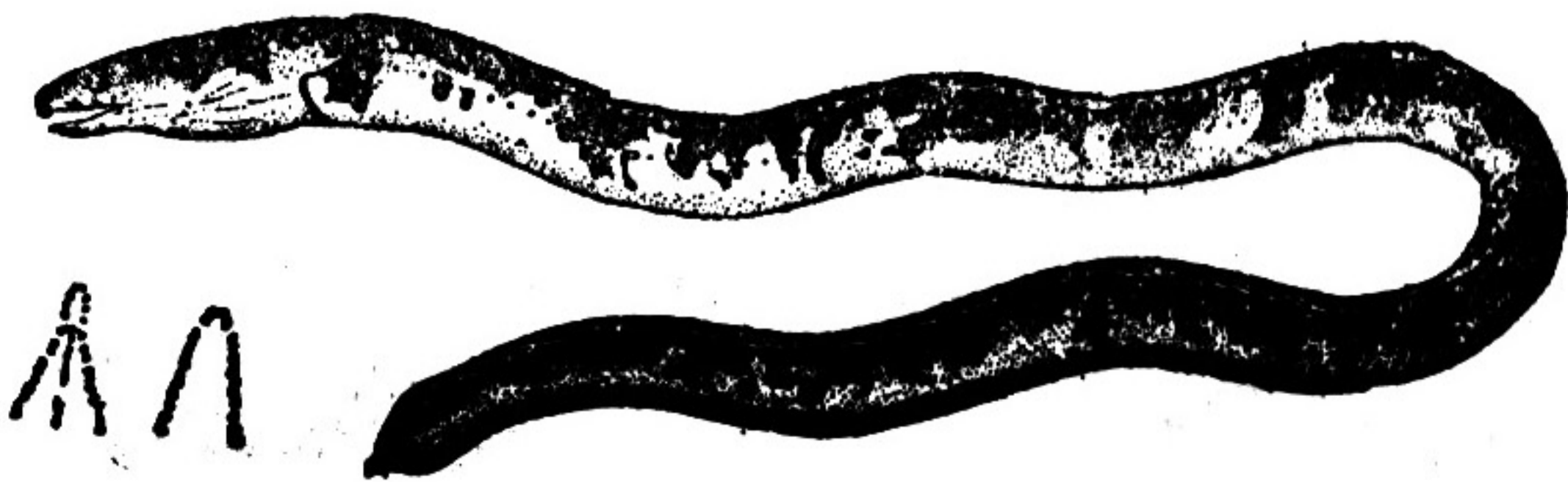
图 278 花斑蛇鳗