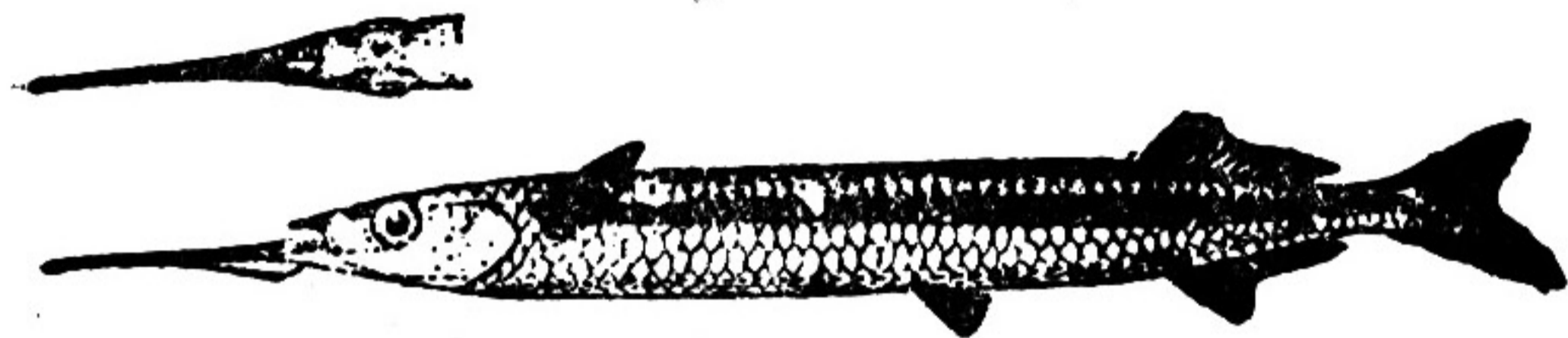
图 287 间 𩚰

体长90—148毫米。体长为体高的8.7—9.8倍,为体宽的10.7—14倍,为头长的4.4—5.1倍。头长为吻长的2.4—2.7倍,为眼径的4—4.5倍,为眼间隔的3.8—4.5倍。体中等大,背腹缘微凸出,体高大于体宽。头较小,前方尖形。吻较