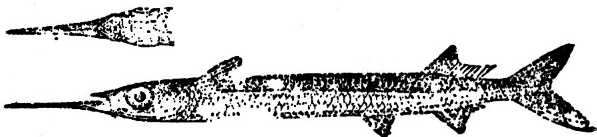
图 286 方柱鱮