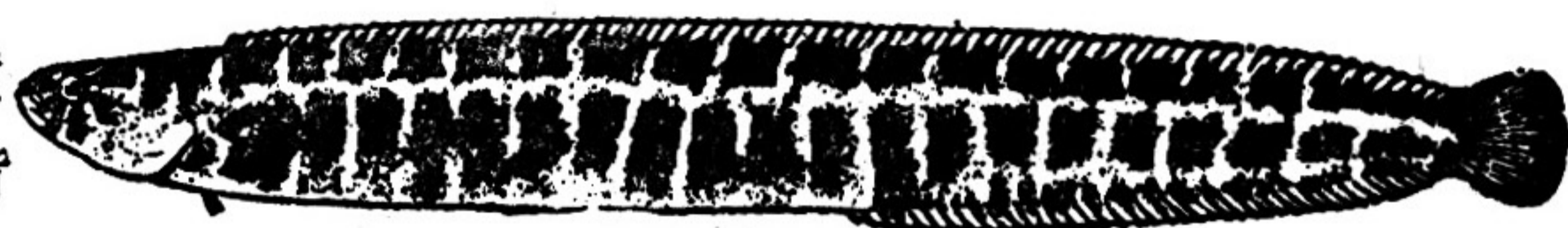
图 469 云鳎