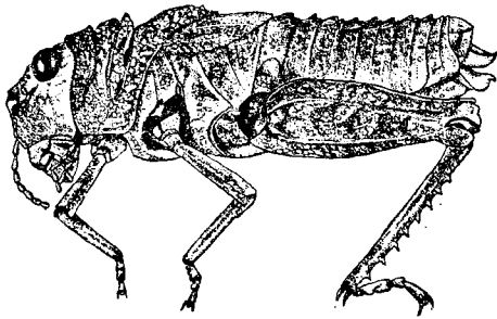
图1 天祝短鼻蝗 Filchnerella tiensuensensis Chang sp. nov. (♀性侧面视)

腹部背板上有三列突起,其中沿中隆线的一列较大,呈片状。第二节背板的前下角有摩擦板。下生殖板后缘中央呈角状突出。产卵瓣钩状,下产卵瓣外缘各有一鹰嘴状缺凹。